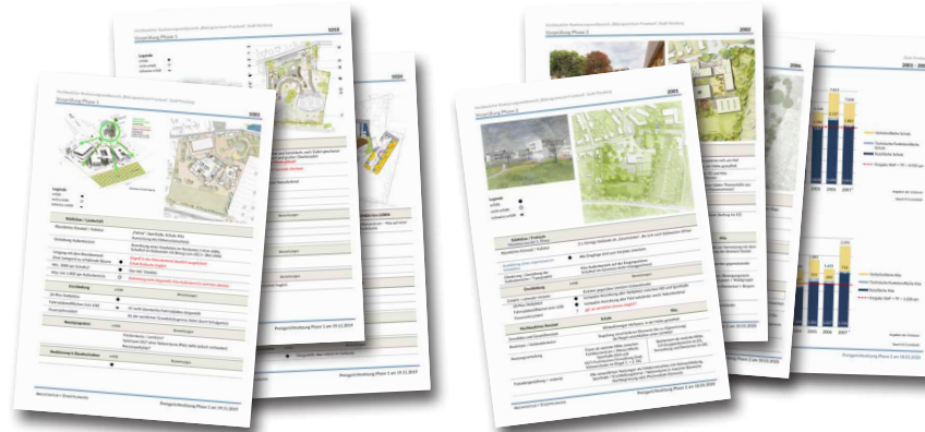
Vorprüfbericht Phase 1

Ziel des Wettbewerbs ist die Erlangung von qualitätsvollen Entwürfen für den Neubau des zukünftigen „Bildungszentrums Fruerlund“: Der Neubau ist dabei in Bauabschnitten im laufenden Betrieb der Grundschule Fruerlund zu realisieren.