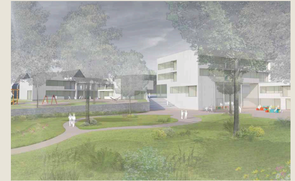
Vorprüfbericht Phase 2