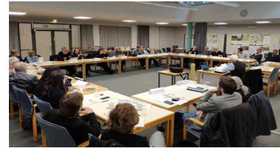
Preisgerichtssitzung Phase 2