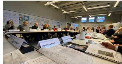
Preisgerichtssitzung Phase 1