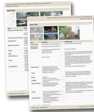
Bericht zur Überarbeitungsphase