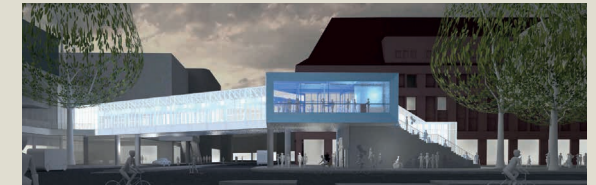
1. Preis: asdfg Architekten, Hamburg