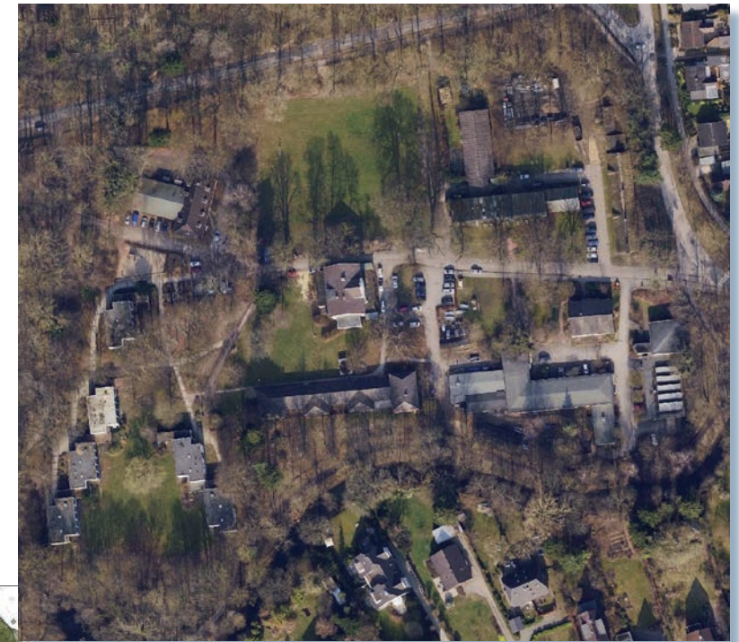
Luftbild (Landeshauptstadt Kiel)