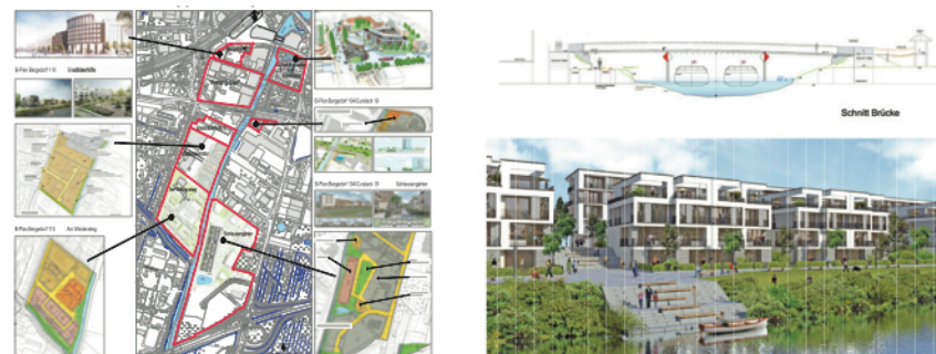
Übersichtsplan und Informationen für die Teilnehmer