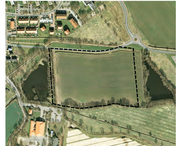
Luftbild / Geltungsbereich