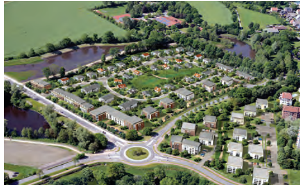
Visualisierung, Gisbert K. Jungermann Architekturillustrationen