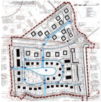
Entwässerungskonzept, Waack + Dähn