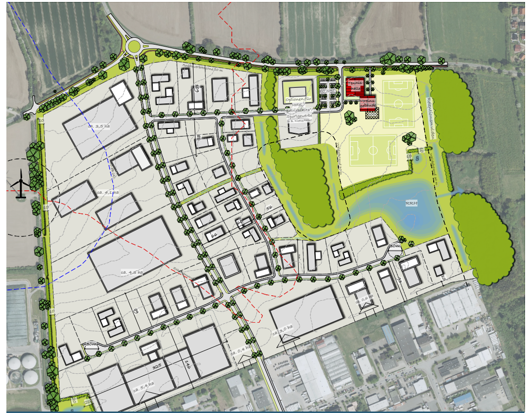
Funktionskonzept (Vorentwurf 08/2022)