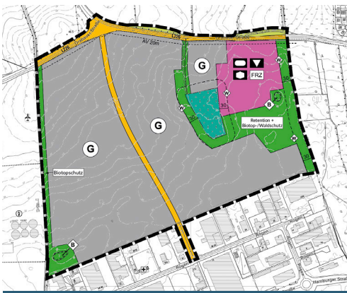
Flächennutzungsplan-Änderung (Vorentwurf 08/2022)