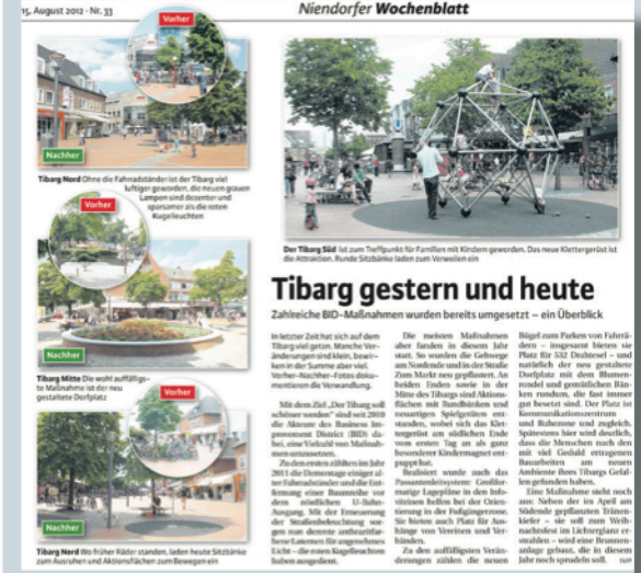
Presse (Niendorfer Wochenblatt)